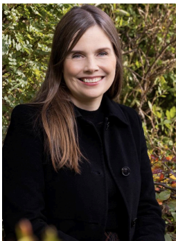
Katrín Jakobsdóttir, forsætisráðherra og Guðmundur Ingi Guðbrandsson, samstarfsráðherra

Samstarf Norðurlanda byggist á sterkum menningarlegum og samfélagslegum tengslum. Við skiptumst á skoðunum, leitum sameiginlegra lausna við áskorunum samtímans og framtíðarinnar og deilum reynslu og þekkingu hvert með öðru.