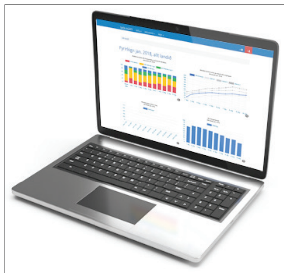
Mynd 2. Dæmi um birtingu niðurstaðna úr lesfímiprófum í Skólagáttinni , gagnagrunni Menntamálastofnunar.

Með því að byggja á ítarlegum upplýsingum um stöðu bekkja og hvers nemanda geta skólastjórnendur, kennarar og skólar mótað áherslur í lestrarkennslu og komið betur til móts við við þarfir einstakra nemenda.